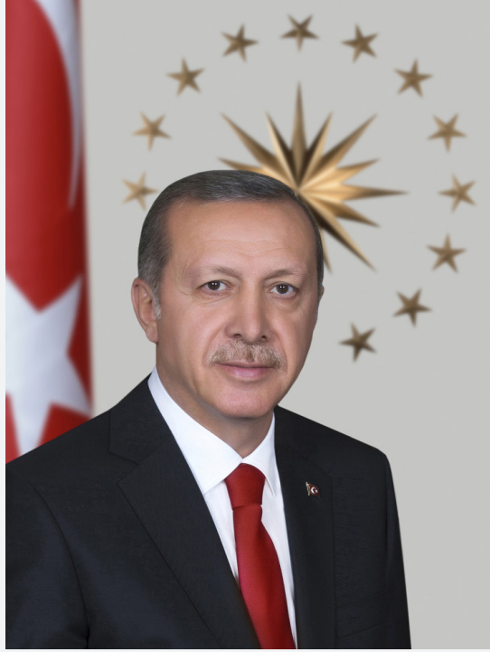
Recep Tayyip ERDOĞAN Cumhurbaşkanı