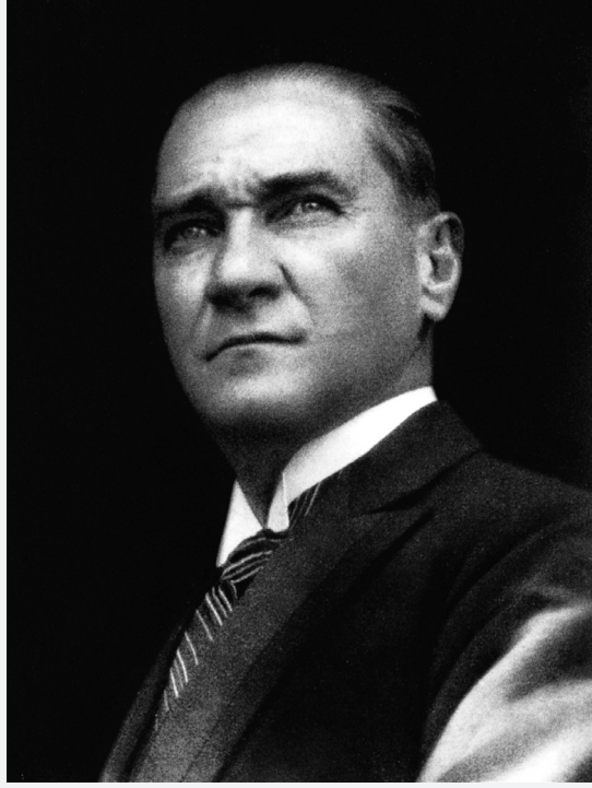
Mustafa Kemal ATATÜRK

Herkesin polisi kendi vicdanıdır; fakat polis vicdanı olmayanların karşısındadır.