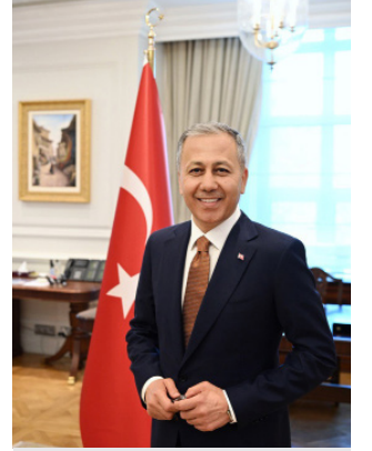
Ali YERLİKAYA İçişleri Bakanı

Bu planın tüm teşkilatımızda azami gayret ve hasasiyetle uygulanacağına yürekten inanıyorum. 2024-2028 Stratejik Planın hazırlanmasında emeği geçen Emniyet Genel Müdürlüğümüzün her kademesindeki mensuplarına teşekkür ediyor, çalışmalarında üstün başarılarının devamını diliyorum.